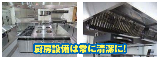
厨房設備は常に清潔に!

日頃のお手入れを心がけて、ガス機器をキレイに保つことが大切です。キレイに使うことで機器は長持ちします。しかし、大切に使っていても経年劣化は避けられません。異常を感じたら放置せず、メーカーなどにメンテナンスを依頼しましょう。