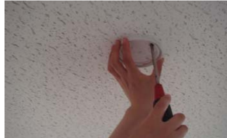
③ ベースを取り付ける