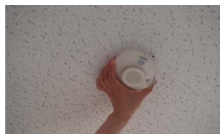
④ 警報器本体を取り付ける